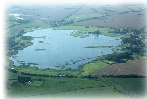
Naturschutzgebiet „Richtenberger See“