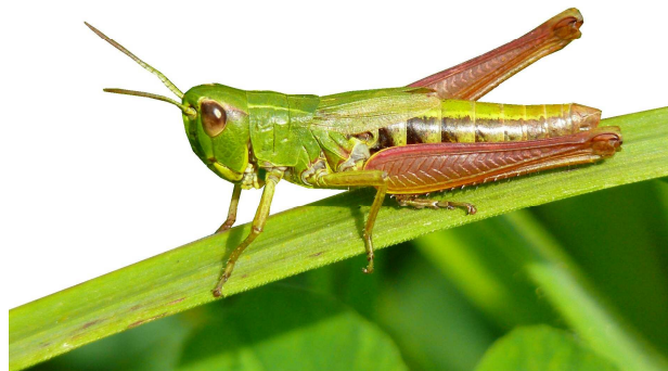
Grashüpfer am Wegesrand